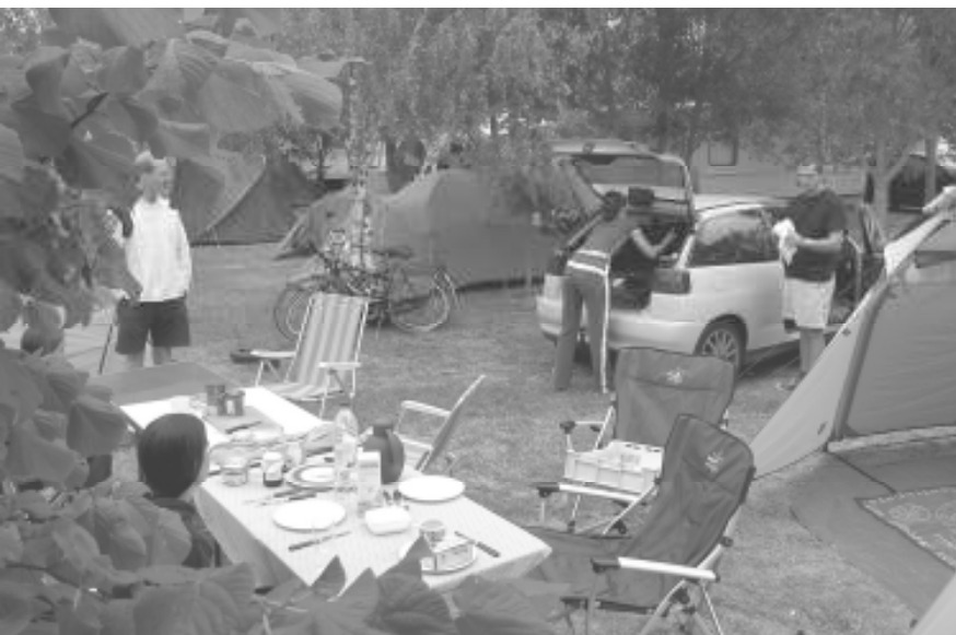
De kampplaats van De Wouw...

Toen we uit onze tentjes kropen en naar de lucht keken, konden we onmiddellijk zien dat het echt super vliegweer ging worden. Eerst maakte ik met Pieter een verkenningsvluchtje met de Ka 7, we stegen bijna vanzelf tot 1000 meter en besloten overland te vertrekken. Samen met Eric en Michaël die met de ASK 13 vlogen, schreven we een proef van een kleine 300 kilometer uit. We stonden in verbinding met bijna onverstaanbare walky-talky's. Het was een prachtige vlucht! De landingen waren wel vrij spectaculair. Michaël en Eric zaten op 2,5 kilometer van het veld op 100 meter hoogte. Ze kwamen al van achter Loches waar ze nog net een laatste pomp hadden genomen, die hen tot 1400 meter