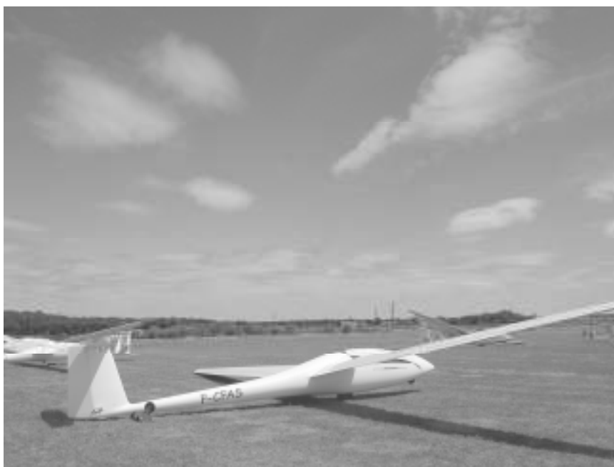
Geen overlandvluchten vandaag...